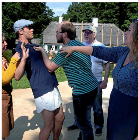
Foto: Skorpen og pigens far, som ikke kunne forlige sig med, at datterens udkårne er en skorpe

Hammermøllens Teatergruppes næste forestilling finder sted i juli/august 2023.